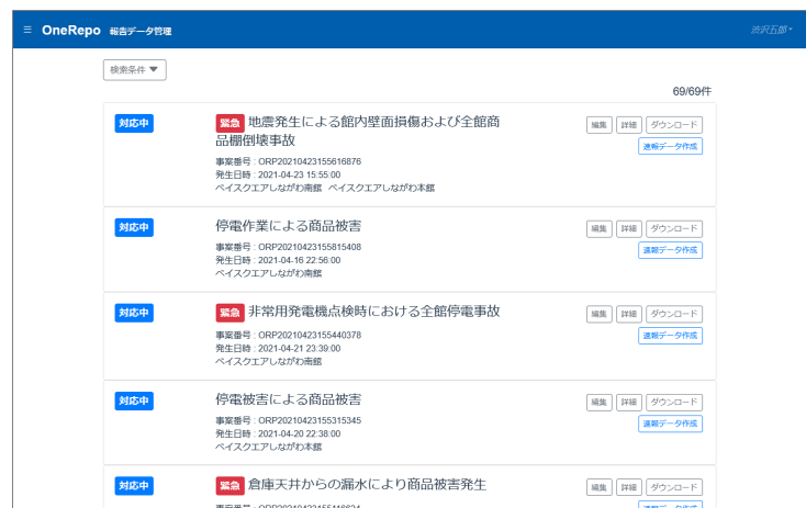
▲ウェブ画面イメージ