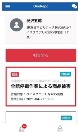
▲アプリ画面イメージ